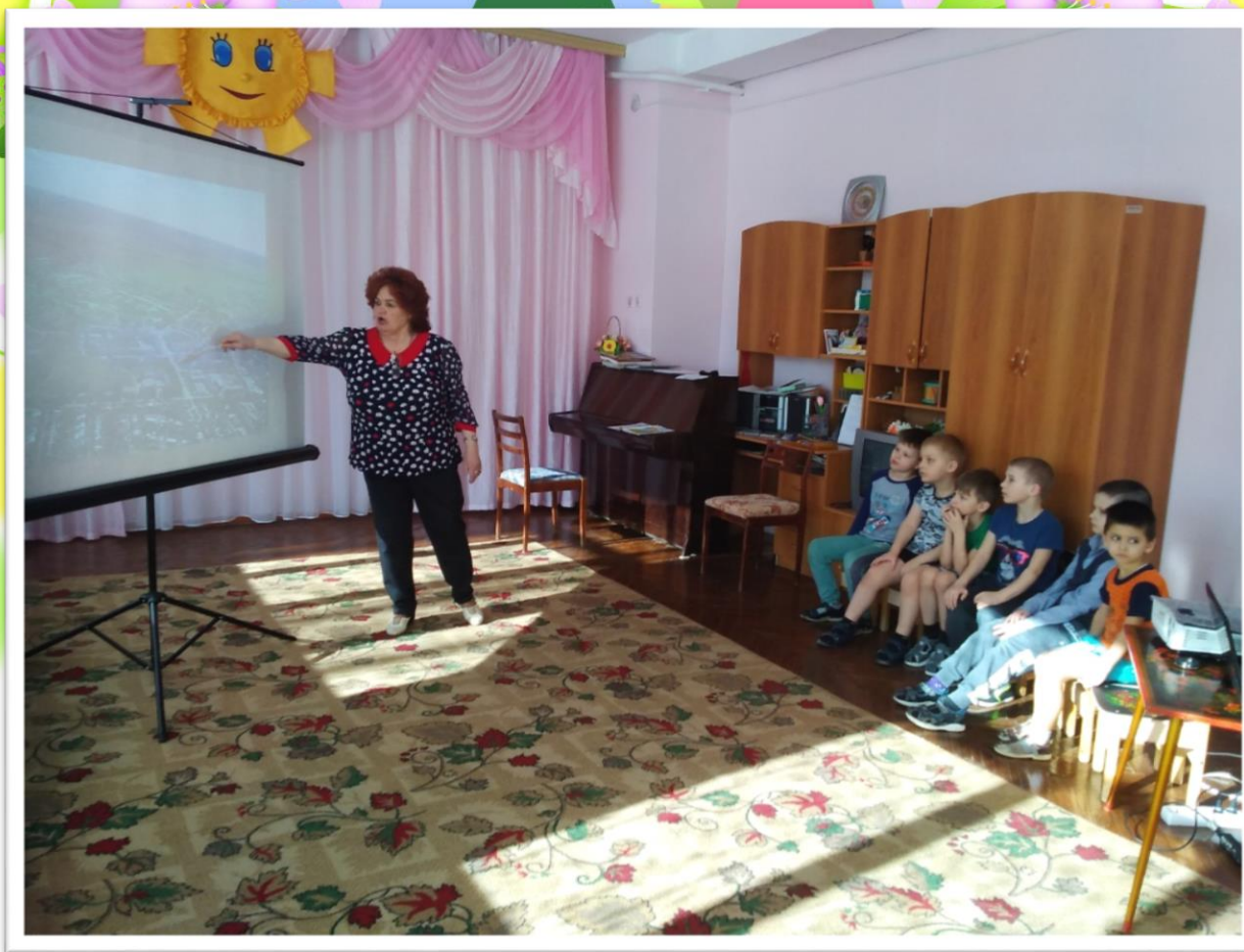
Просмотр презентации и беседа «Мой текстильный город»